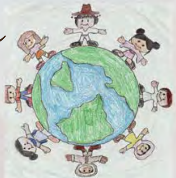
Illustrazione grafica Ananya | SSE Gruppo 3 | USA