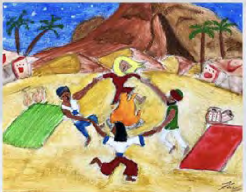
Illustrazione grafica Koushik | SSE Gruppo 4 | USA